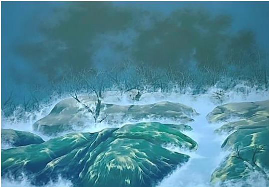
Yonghyeon Yang, En Passant n°9 , 2024, acrylique sur toile, 50x70 cm.