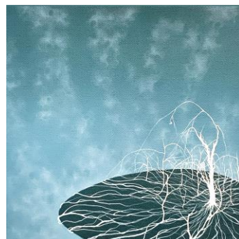
Yonghyeon Yang, En Passant n°16 , 2025, acrylique sur toile, 20x20 cm.