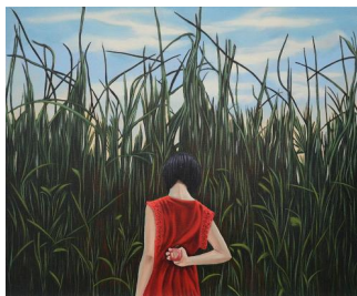
Nattan Kongmalikunkaew, Hidden Temptation, 2026, huile sur toile, 50x60 cm

Son travail est une méditation sur l'éphémère. Les sentiers qu'il suggère ne mènent pas à une destination, mais à une réflexion sur ce qui persiste, sur ce qui disparaît, et sur la beauté des instants fragiles. En regardant ses toiles, on a l'impression de marcher sur un chemin qui n'existe pas encore, ou qui n'existe plus - un sentier de l'invisible, tracé par l'émotion et l'imaginaire.