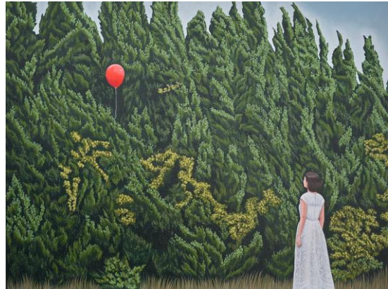
Nattan Kongmalikunkaew, Reflection of Memory : The Fracture between Reality and Imagination, 2026, huile sur toile, 60x80 cm