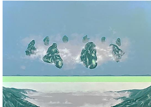
Yonghyeon Yang, En Passant n°8 , 2024, acrylique sur toile, 50x70 cm.