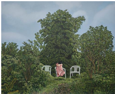
Nattan Kongmalikunkaew, Waiting for the Void, 2026, huile sur toile, 50x60 cm