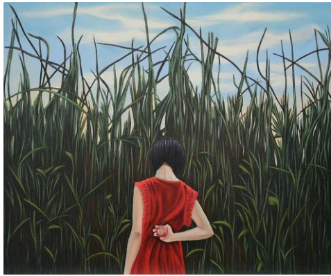
Nattan Kongmalikunkaew, Hidden Temptation, 2026, huile sur toile, 50x60 cm