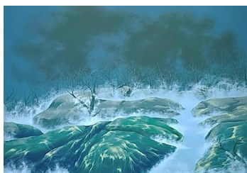
Yonghyeon Yang, Déconstruire n°9, 2024, Acrylique sur toile, 50x70 cm