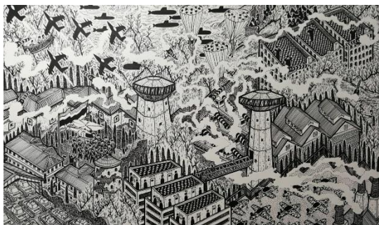
Kwanchai Lichaikul – welcome to military zone No entry - acrylic on canvas – 60x100 – 2019

Utilisant la technique du dessin, les œuvres, observées de loin, sont un enchevêtrement innombrable de traits proche de l'abstraction, un portrait intime d'un système désorganisé dans une société non planifiée. En y regardant de plus près, le spectateur reconnaîtra bientôt le désarroi suscité par le chaos urbain.