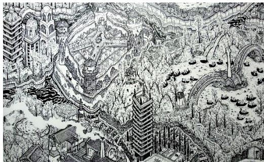
Kwanchai Lichaikul – untitled - acrylic on canvas – 60x100 – 2019