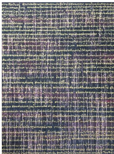
Jason Tamthai- Voices – serie world - Oil on canvas 120 x 90cm - 2015

L'abstraction minimaliste de la série « light » représente l'abondance des quatre éléments - eau, terre, feu et vent - présents dans ce pays tropical et luxuriant qu'est la Thaïlande. La technique des cascades et coulures de peinture propre à Tamthai transporte le spectateur dans un voyage au cœur de la nature et de l'émotion thaïlandaise.